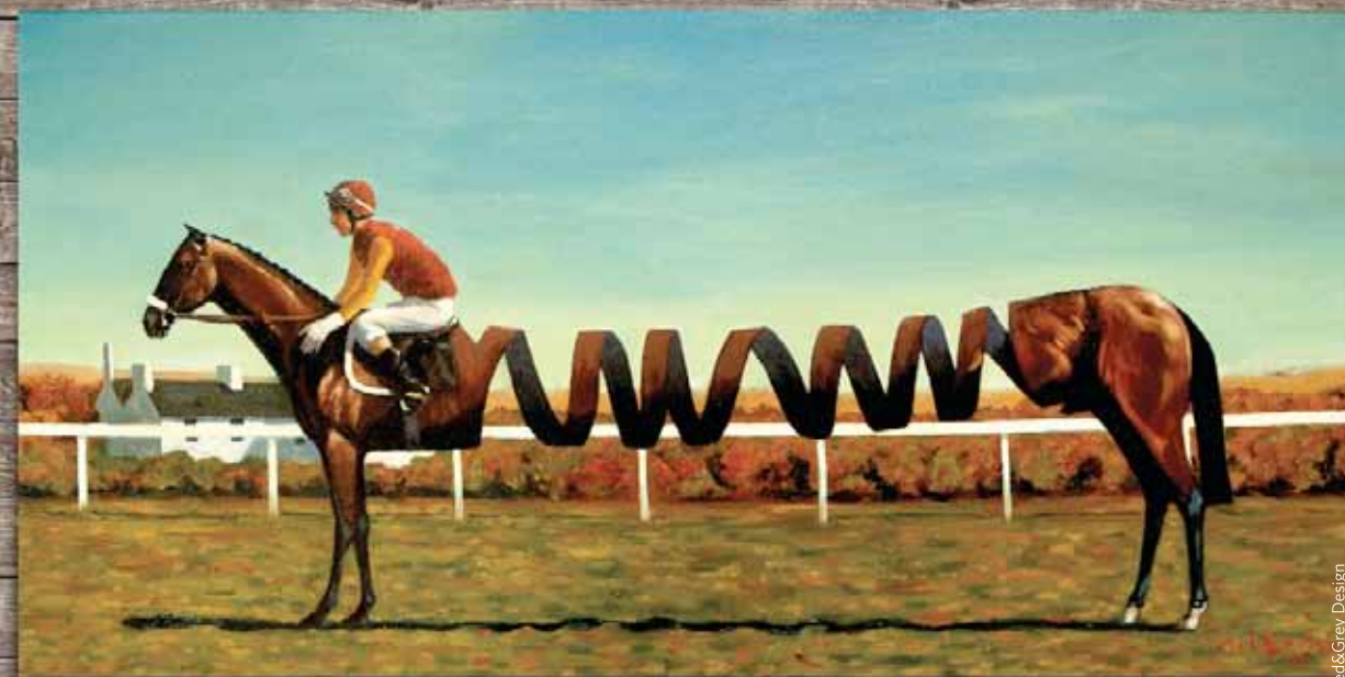
Design by Red&Grey Design www.redandgreydesign.ie